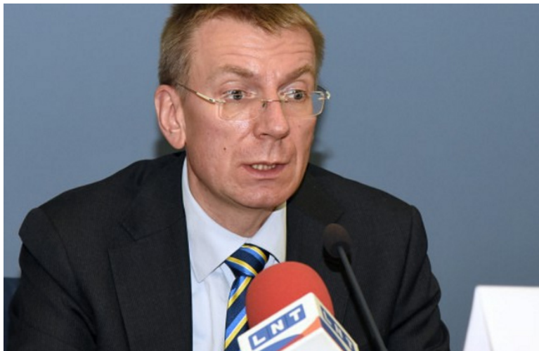
Latvijas ārlietu ministrs Edgars Rinkēvičs

Ministrs skaidroja, ka visi vēlas redzēt jaunu un reformētu ES, kas ir daudz pietuvinātāka saviem iedzīvotājiem, nekā tā bija