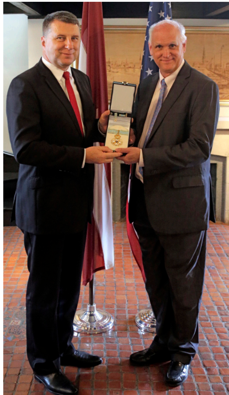
Valsts prezidents Raimonds Vējonis pasniedz Triju Zvaigžņu ordeni Džeimsam Taunsendam.