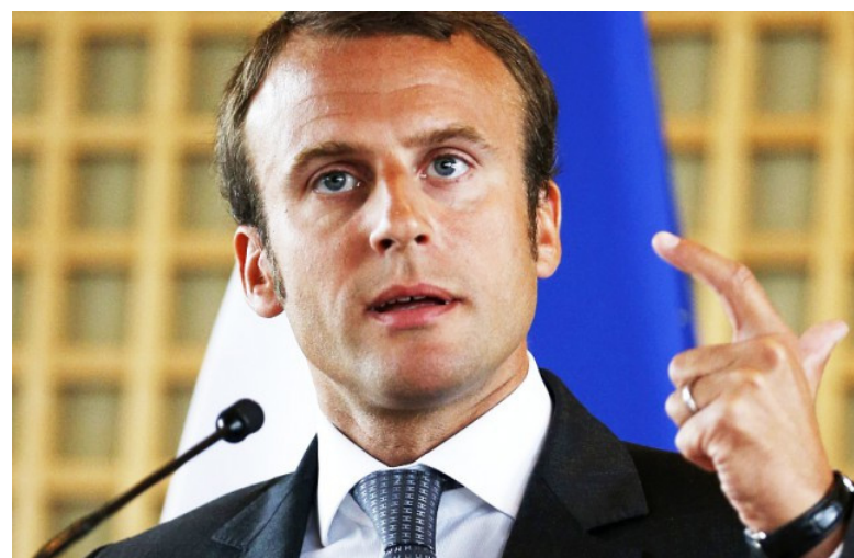
Emanuel Makrons.