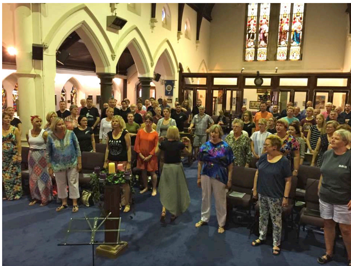
Kopkoņa mēģinājums.