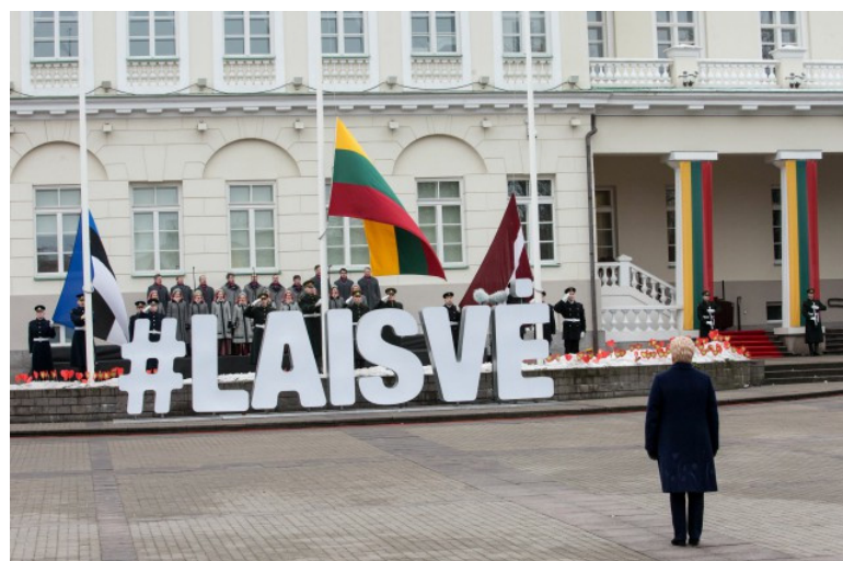
Pusdienlaikā Neatkarības laukumā tika svinīgi uzvilkti triju Baltijas valstu karogi.

Lietuva 11. martā svinēja Neatkarības atjaunošanas dienu - 27. gadskārtu, kopš toreizējā Lietuvas Augstākā Padome jeb Atjaunotais Seims pieņēma aktu par valstiskās neatkarības atjaunošanu.