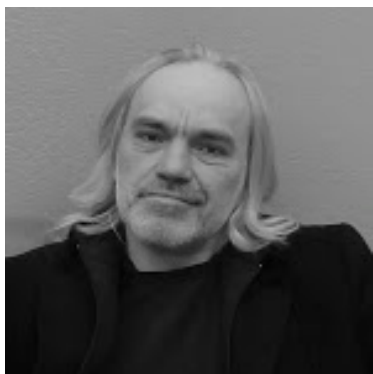
Uģis Prauliņš.

Prestīžās Vācijas klasiskās mūzikas godalgas "ECHO Klassik" žūrija paziņojusi šā gada balvas ieguvējus, un godalgoto mūzikas albumu vidū ir arī latviešu mākslinieku – mecosoprāna Elīnas Garančas, komponista Uģa Prauliņa un