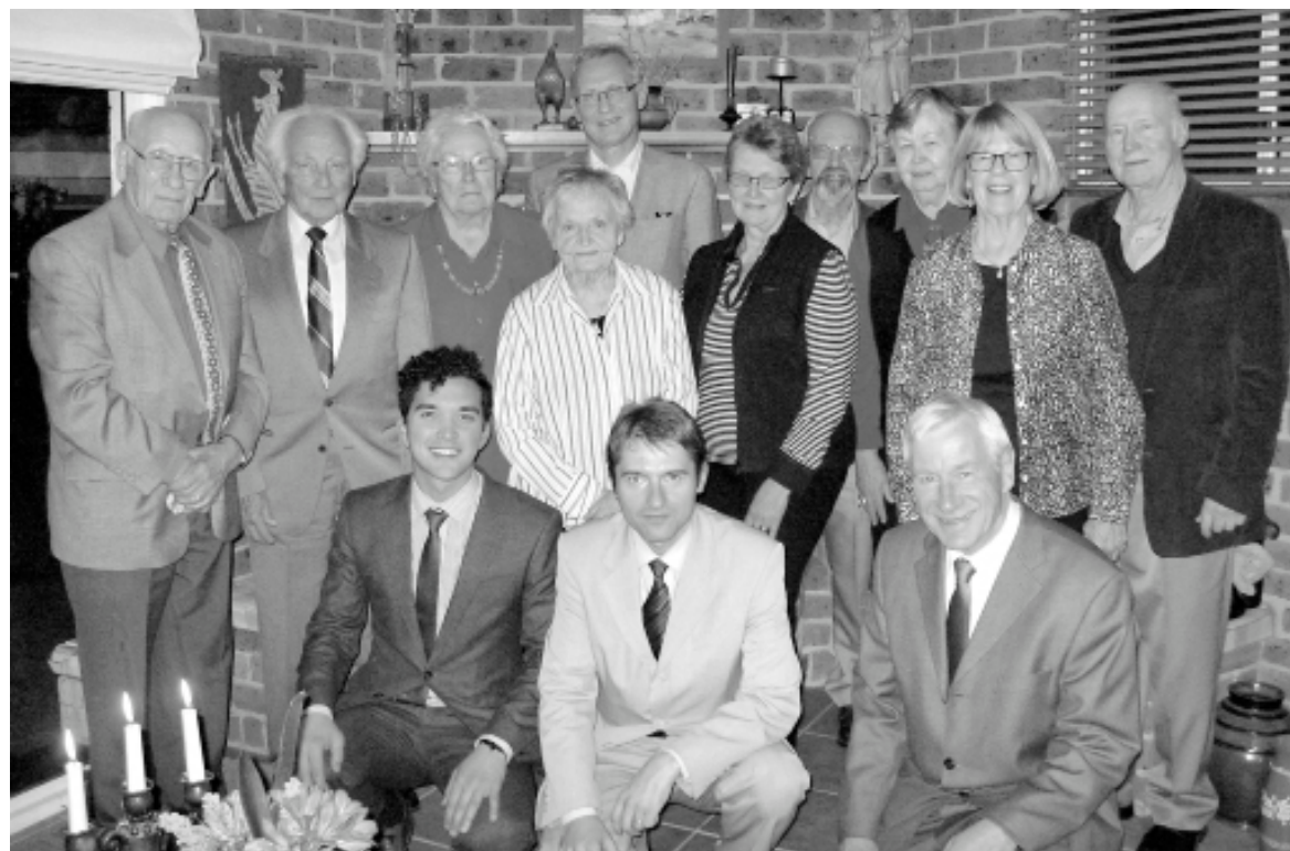
Latvijas vēstnieks Andris Teikmanis un Oļegs Orlovs ar Kanberas latviešu saimes locekļiem.

Sarunās pacēlās jautājums par Kanberā dzīvojošo latviešu vēlēšanas ietilpt Sidnejas Latvijas goda konsulāta pakļautībā. (Turpinājums 7. lpp.)